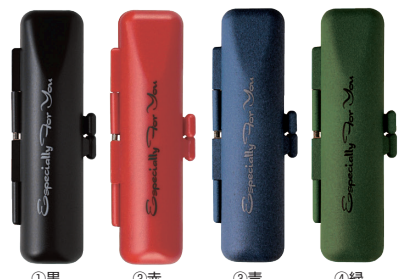
①黒 ②赤 ③青 ④緑