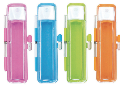
①ピンク ②ブルー ③グリーン ④オレンジ