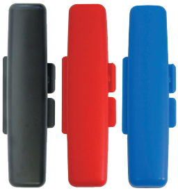
①黒 ②赤 ③青