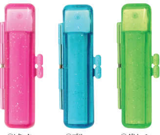
①ピンク ②ブルー ③グリーン