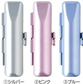
①シルバー ②ピンク ③ブルー