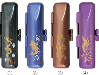
① ② ③ ④