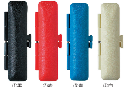
①黒 ②赤 ③青 ④白