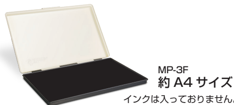
MP-3F 約A4サイズ インクは入っておりません。