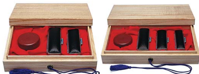
③ ※外形52mm丸の朱肉が入ります (朱肉は付きません)

※外形52mm丸の朱肉が入ります (朱肉は付きません) ※印鑑ケースは付きません。