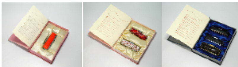
※印材・印鑑ケースは付きません。