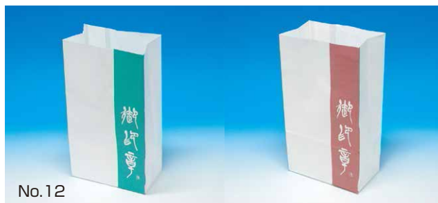
ニューデザイン紙袋