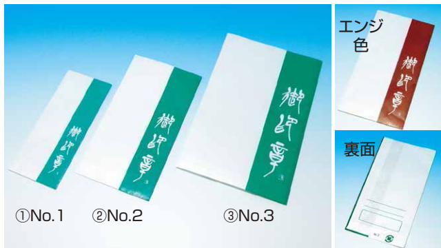
ニューデザイン紙袋