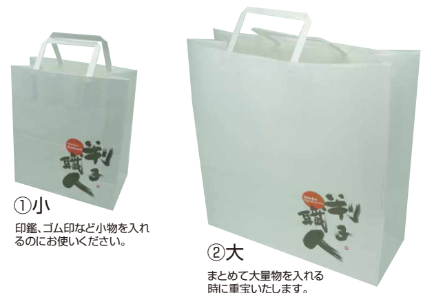
判子職人手提げ袋