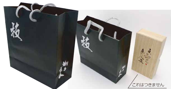
判子職人高級手提げ袋 ブラック

人気の判子職人シリーズに印鑑用の高級紙手提げ袋が発売になりました。印鑑以外に、日常にでもお使いいただけるおしゃれな手提げ袋です。