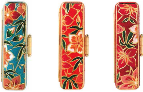
① D-33 ② D-34 ② D-35