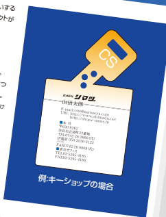
例:キーンショップの場合

オリジナルシルエットも承ります。 (1点につき¥10,000) ご希望のイメージをご指示下さい。 修正は2回まで無料。以降は1回につ き修正料¥2,000(税抜)が必要です。 受注後のキャンセルはキャンセル料を申し込 びます。