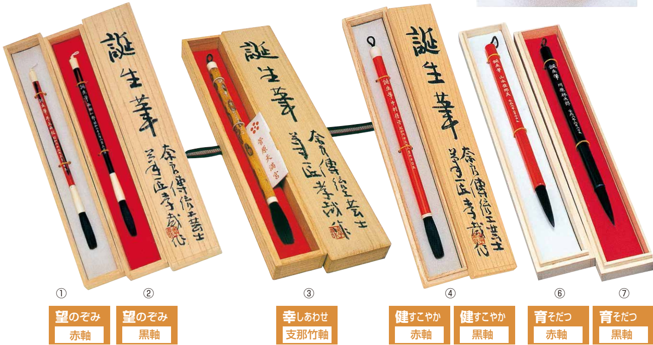
① 望のぞみ 赤軸 ② 望のぞみ 黒軸 ③ 幸しあわせ 支那竹軸 ④ 健すこやか 赤軸 ⑤ 健すこやか 黒軸 ⑥ 育そだつ 赤軸 ⑦ 育そだつ 黒軸

日本では古く江戸時代からこの習慣は筆作り発祥の地奈良において盛んに行われていましたが、近年になってお子様の誕生、七五三、そして記念の品として成人の日、嫁ぐ日に親が子に贈る人生のお守りとして静かなブームを呼んでいます。